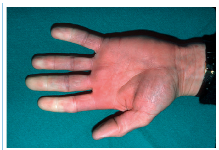
Figure 1 Attaque de Raynaud se manifestant par des extrémités digitales pâles, le pouce restant typiquement épargné.