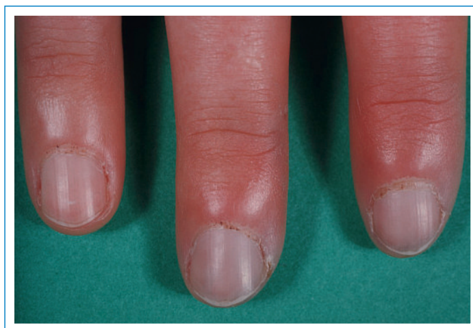
Figure 3 Repli sus-unguéal lors de sclérodémie, avec saignements capillaires spontanés et mégacapillaires, ici déjà visibles à la loupe.