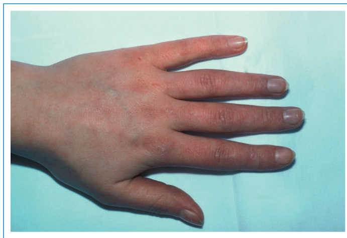
Figure 4 Acrocyanose.

penser à une artériosclérose précoce des artères digitales. Au point de vue clinique, le test d'Allen (serrer le poing) permet de vérifier le soupçon d'occlusion des artères digitales ou de l'arc palmaire profond. Pour exclure l'occlusion des artères digitales, on peut recourir à l'oscillographie après réchauffement.