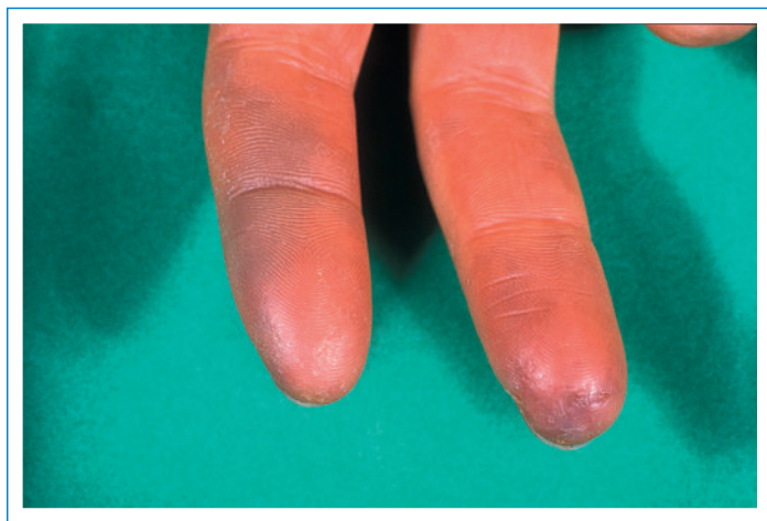
Figure 2 Nécrose en «morsure de rat» caractéristique lors d'un phénomène de Raynaud secondaire.