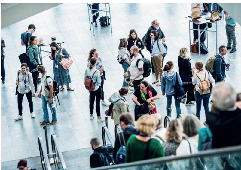
Figure 1: Trois jours de congrès très animés à Lausanne.