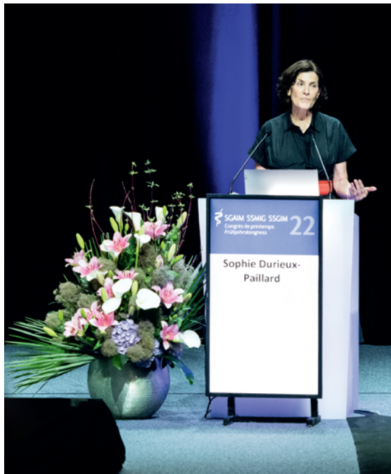
Figure 3: President's Lecture de la Dre méd. Sophie Durieux-Paillard.

contournable President's Lecture, la Dre Sophie Durieux-Paillard a ensuite répondu à la question essentielle: Le traitement des réfugiés constitue-t-il une nouvelle spécialité médicale ou fait-il partie des activités clés de la médecine interne générale?