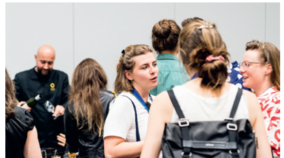
Figure 4: En plein networking « How to jump-start your research career in Internal Medicine ».