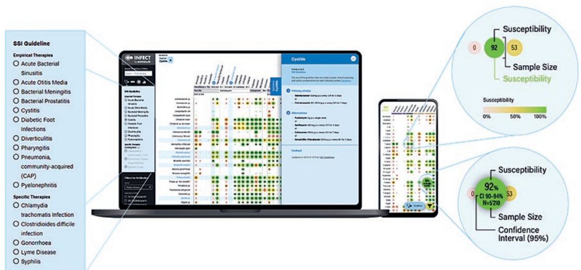
Abbildung 3: Die App INFECT by anresis existiert als Web-Anwendung (www.infect.info) und als mobile App (Download via Google Play Store und Apple App Store). Sie zeigt die aktuellen Resistenzdaten (Punkte) und enthält nationale Guidelines (blaues Panel rechts) der Schweizerischen Gesellschaft für Infektiologie (SSI). Konfidenzintervall und Probenanzahl werden beim Anwählen der Punkte angezeigt (links unten).

Neben Resistenzdaten sammelt ANRESIS aggregierte Antibiotikaverbrauchsdaten von 70 Spitälern und über 1000 Apotheken. Die analysierten Daten werden in