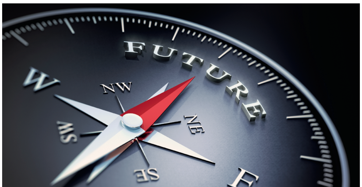
Die Kompassnadel der neuen Strategie weist in die Zukunft der SGAIM.

Korrespondenz: Claudia Schade Kommunikations- verantwortliche und stellvertretende Generalsekretärin Schweizerische Gesellschaft für Allgemeine Innere Medizin Monbijoustrasse 43 Postfach CH-3001 Bern claudia.schade[at]sgaim.ch