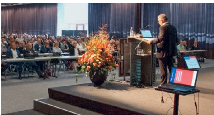
«Pure Medicine» sous toutes ses facettes.