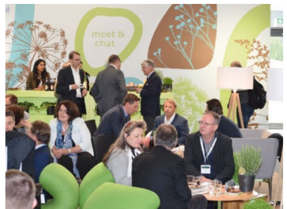
Figure 1: Nouveau lounge SSMIG au congrès de printemps à Lausanne.

En 2017, la SSMIG s'est exprimée de concert avec l'AMCIS ( Association des Médecins-chefs et -cadres Internistes Hospitaliers Suisse ) au sujet des recommandations de H+