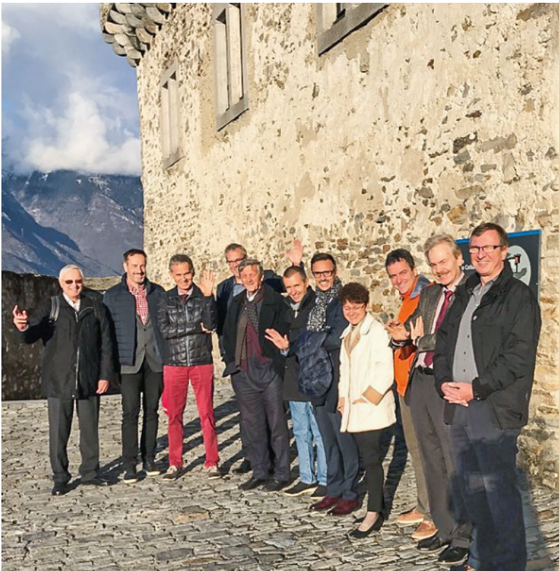
Figure 2: Quelques-uns des participants qui ont visité le musée du château de Sasso Corbaro à la fin de la journée de formation.

Correspondance: Bruno Schmucki Kommunikation, SGAIM Schweizerische Gesellschaft für Allgemeine Innere Medizin Monbijoustrasse 43 Postfach CH-3001 Bern bruno.schmucki[at]sgaim.ch