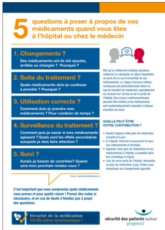
Figure 1: Flyer pour les patients.