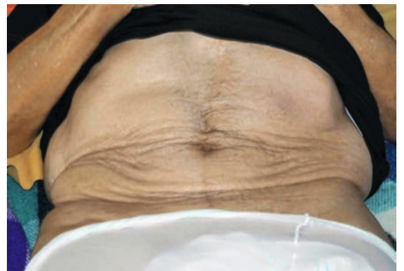
Figure 2: Abdomen après évacuation de 3 litres d'urine.