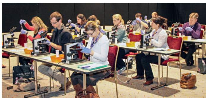
Figure 1 Impression d'un atelier de 2013.

Le Great Update de la SSMI est une manifestation bilingue. La participation active d'acteurs de Suisse romande avec environ un tiers des visiteurs est une grande satisfaction pour nous depuis le com-