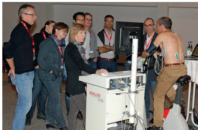
Figure 1 Great Update 2012: Discussions animées entre les exposants et les visiteurs du congrès.

Le Great Update de la SSMI est une manifestation bilingue. En 2011 et 2012, nous nous sommes particulièrement réjouis de l'active participation de la Suisse romande. Cette année également, les contributions en langues allemande et française se succéderont. Le programme prévoit entre autres des conférences sur des thèmes tels que la fibrillation auriculaire, les examens préopératoires, l'insuffisance cardiaque, les douleurs abdominales, les affections de la thyroïde et le diagnostic des nodules pulmonaires. Les ateliers seront animés par des internistes généralistes, par des confrères issus de disciplines spécifiques de médecine interne et par des représentants d'autres domaines. Vous pourrez par exemple évaluer des sédiments urinaires, vous exercer de manière pratique au traitement des plaies ou à la spirométrie et acquérir des connaissances précieuses concernant la réanimation. Parmi les autres thèmes abordés dans les ateliers se trouvent aussi le diagnostic de la dyspnée, la diabétologie illustrée par des cas pratiques, ainsi que l'évaluation de clichés radiographiques du thorax. Vous seront également proposés des conseils relatifs aux applications utiles en cabinet médical et des précisions concernant la lecture critique d'articles scientifiques. Les nouveautés de cette année sont les exposés «Hot Topics» du Prof. Dr méd. Jonas Rutishauser et du Prof. Dr méd. Jörg Leuppi.