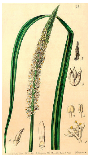
Figure 3 Cévadille ( Veratrum sabadilla ).